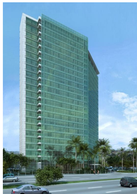
Residência du Lac - Ilustração da fachada e interior

Aviso Importante: Os leitores/investidores devem estar cientes de que muitos fatores podem afetar nossos resultados, fazendo com que sejam materialmente diferentes das projeções contidas nesse comunicado. A companhia não está obrigada a atualizar tais afirmações. As palavras "antecipar", "esperar", "estimar", "prever", "pretender", "planejar", "projetar", e termos similares são utilizados para identificar tais afirmações. As projeções referem-se a eventos futuros que podem ou não vir a ocorrer. Nossa futura situação financeira, resultados operacionais, participação de mercado e posicionamento competitivo podem diferir substancialmente daqueles expressos ou sugeridos em tais projeções. Muitos dos fatores e valores que estabelecem esses resultados estão fora do controle ou expectativa da companhia. O leitor/investidor é encorajado a não se basear totalmente nas informações acima. O volume geral de vendas (VGV) do projeto foi estimado com base na área de venda planejada pela equipe de engenharia e a expectativa do preço de cada unidade estipulado por corretores especializados na região.