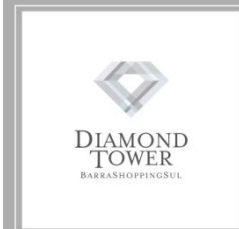
Diamond Tower - Ilustração da fachada e interior