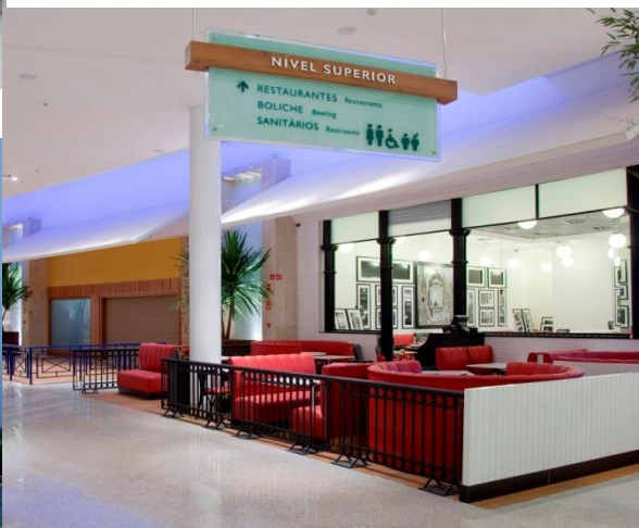
Área Gourmet - restaurantes

Disclaimer: Os leitores/investidores devem estar cientes de que muitos fatores podem afetar nossos resultados fazendo com que sejam materialmente diferentes das projeções contidas nesse comunicado. A companhia não está obrigada a atualizar tais afirmações. As projeções referem-se a eventos futuros que podem ou não vir a ocorrer. Nossa futura situação financeira, resultados operacionais, participação de mercado e posicionamento competitivo podem diferir substancialmente daqueles expressos ou sugeridos em tais projeções. Muitos dos fatores e valores que estabelecem esses resultados estão fora do controle ou expectativa da companhia. O leitor/investidor não deve se basear exclusivamente nas informações acima para tomar decisões com relação à negociação de valores mobiliários de emissão da Multiplan.