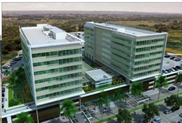
Projeto do ParkShopping Corporate