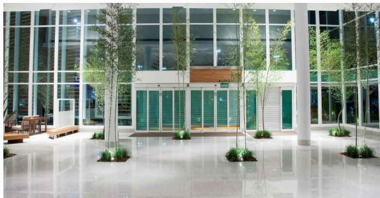
Entrada da Área Gourmet

Vice Presidente e Diretor de Relações com Investidores