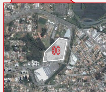
Vista aérea do ParkShopping Barigüi. A expansão será no lado esquerdo do shopping em frente a área verde.

1 – De acordo com a segmentação da renda por classe do IBGE 2 – Fonte: IBGE/2005