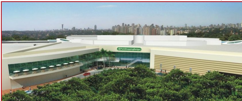
Design preliminar da expansão do ParkShopping Barigüi