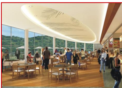
Vista preliminar da nova praça de alimentação