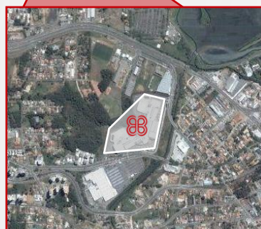
Vista aérea do ParkShopping Barigüi. A expansão será no lado esquerdo do shopping em frente a área verde.

1 – De acordo com a segmentação da renda por classe do IBGE 2 – Fonte: IBGE/2005