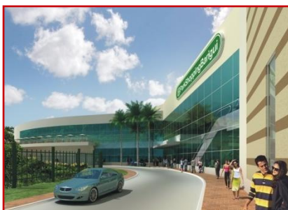
Vista preliminar do exterior do shopping