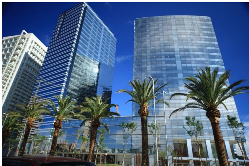
Morumbi Corporate – fachada

Vice Presidente e Diretor de Relações com Investidores