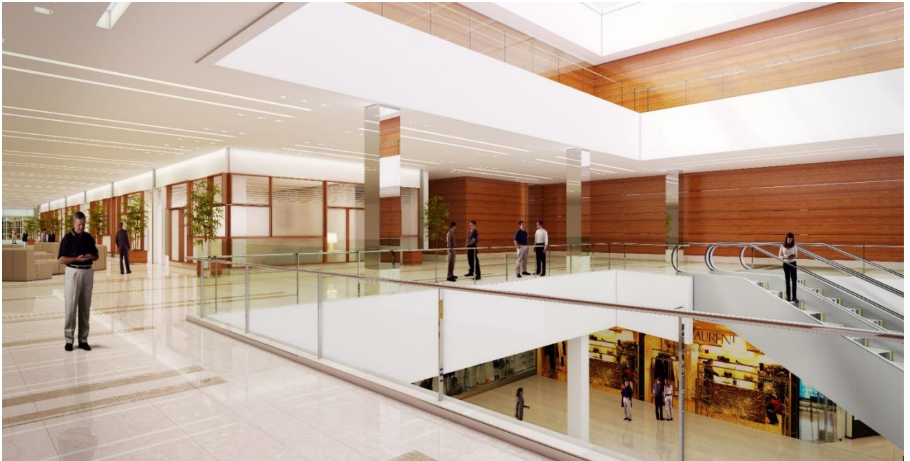
Centro Médico RibeirãoShopping – acesso pelo shopping center – sujeito a modificações