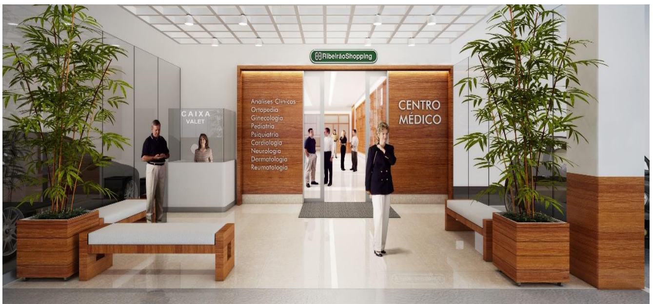
Centro Médico RibeirãoShopping – Ilustração artística do projeto – sujeito a modificações

O RibeirãoShopping foi inaugurado em 5 de maio de 1981 e atualmente é o centro de uma movimentada região de Ribeirão Preto (SP), recebendo mais de 10 milhões de visitas por ano. O shopping center já passou por oito expansões, conta com 400 operações comerciais e, com a primeira fase da 9ª expansão, terá 72,9 mil m 2 de ABL.