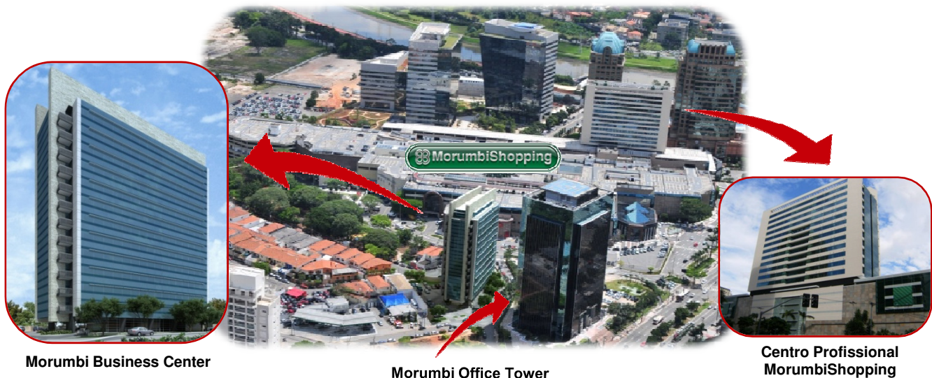
Morumbi Business Center