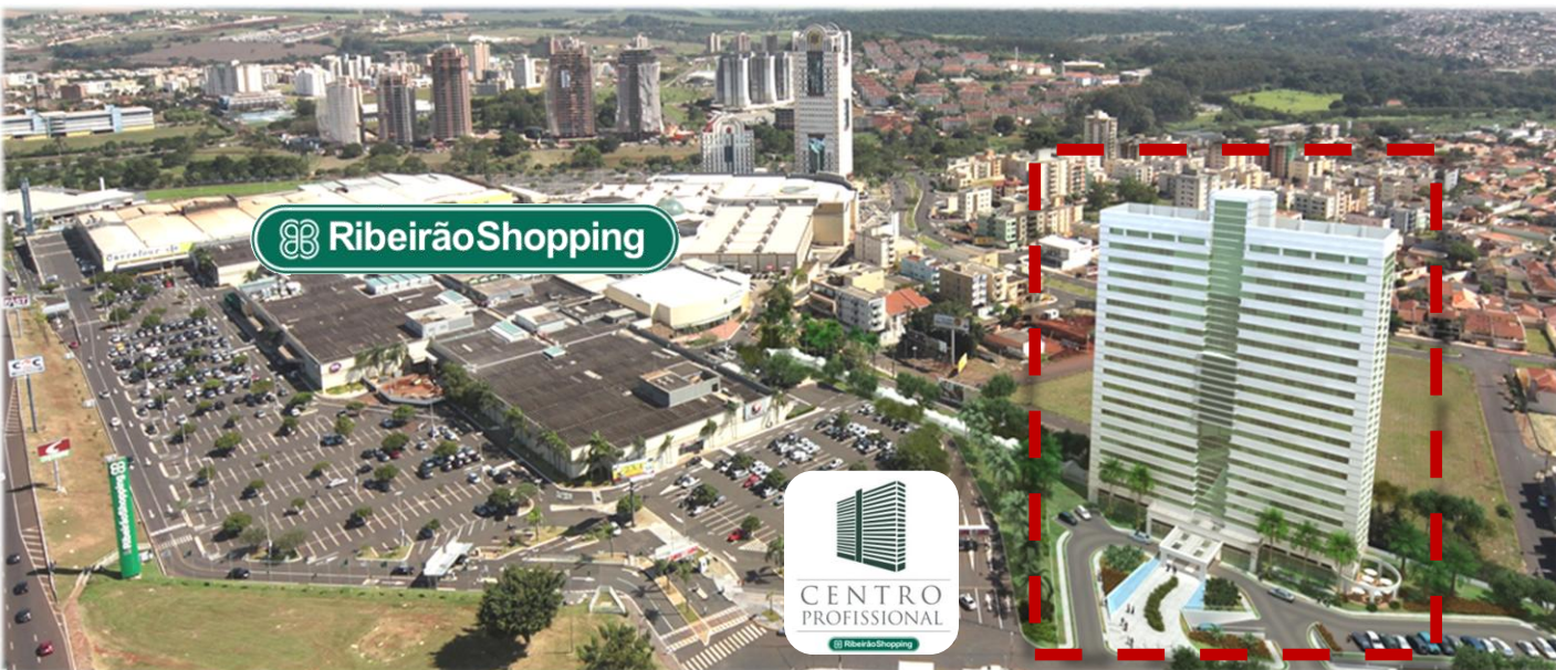
Ilustração do Centro Profissional RibeirãoShopping, adjacente ao RibeirãoShopping

Aviso Importante: Os leitores/investidores devem estar cientes de que muitos fatores podem afetar nossos resultados, fazendo com que sejam materialmente diferentes das projeções contidas nesse comunicado. A companhia não está obrigada a atualizar tais afirmações. As palavras "antecipar", "esperar", "prever", "pretender", "planejar", "projetar", "objetivar" e termos similares são utilizados para identificar tais afirmações. As projeções referem-se a eventos futuros que podem ou não vir a ocorrer. Nossa futura situação financeira, resultados operacionais, participação de mercado e posicionamento competitivo podem diferir substancialmente daqueles expressos ou sugeridos em tais projeções. Muitos dos fatores e valores que estabelecem esses resultados estão fora do controle ou expectativa da companhia. O leitor/investidor é encorajado a não se basear totalmente nas informações acima. O volume geral de vendas (VGV) do projeto foi estimado com base na área de venda planejada pela equipe de engenharia e a expectativa do preço de cada unidade estipulado por corretores especializados na região.