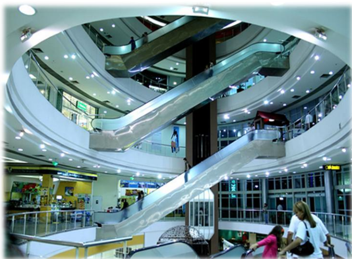
Revitalização recente do interior do Shopping Santa Úrsula