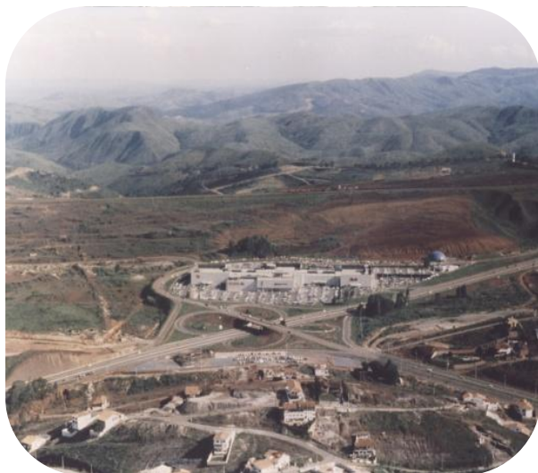
BH Shopping em 1979 Lojas: 130 ABL: 18.974 m 2