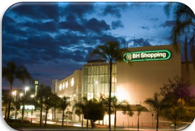
Fachada BH Shopping, 2009

Além disso, a receita de estacionamento também vem demonstrando sólidos resultados desde 2006: a taxa de crescimento anual composta (na sigla em inglês, CAGR), desde o 3T06, foi 87,0% (sendo que o shopping center iniciou a cobrança de estacionamento em 2001, tornando-se o primeiro a fazê-lo na cidade de Belo Horizonte). Estes valores devem crescer ainda mais nos próximos meses, dado que um novo deck parking, parcialmente entregue em novembro de 2008, deverá estar operando integralmente quando da data de inauguração da Expansão V do BH Shopping.