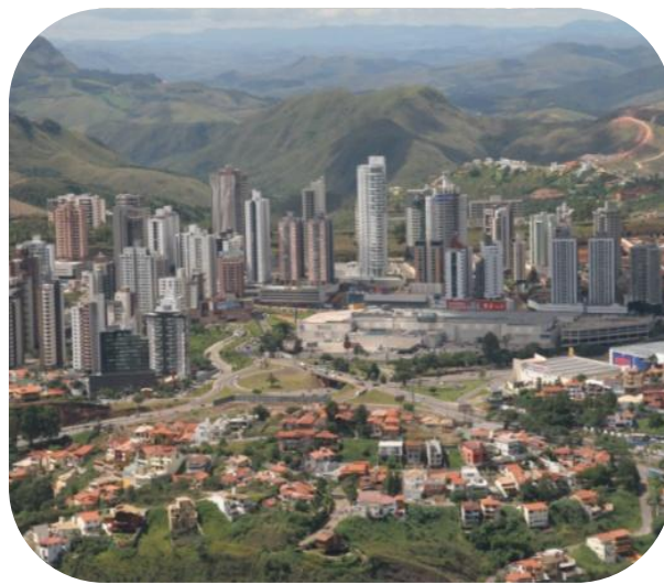
BH Shopping em 2008 Lojas: 295 ABL: 35.528 m 2

O BH Shopping foi o primeiro shopping desenvolvido e incorporado pela Multiplan, além de ter sido o primeiro do gênero no estado de Minas Gerais. Inaugurado em setembro de 1979, o BH Shopping contribuiu para o desenvolvimento da cidade de Belo Horizonte, e ainda é considerado um dos principais centros comerciais da região. Este fato deve-se ao investimento da Multiplan no BH Shopping: desde sua inauguração, o shopping já recebeu quatro expansões (a quinta está atualmente em construção), sem mencionar os investimentos efetuados na reforma do imóvel.