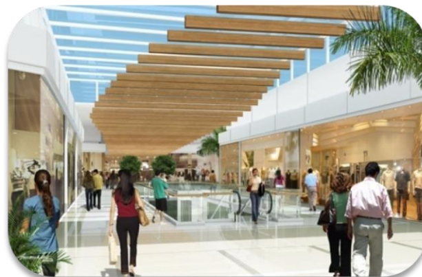
BH Shopping Expansão V

O BH Shopping foi o primeiro shopping desenvolvido e incorporado pela Multiplan, além de ter sido o primeiro do gênero no estado de Minas Gerais. Inaugurado em setembro de 1979, o BH Shopping contribuiu para o desenvolvimento da cidade de Belo Horizonte, e ainda é considerado um dos principais centros comerciais da região. Este fato deve-se ao investimento da Multiplan no BH Shopping: desde sua inauguração, o shopping já recebeu quatro expansões (a quinta está atualmente em construção), sem mencionar os investimentos efetuados na reforma do imóvel.