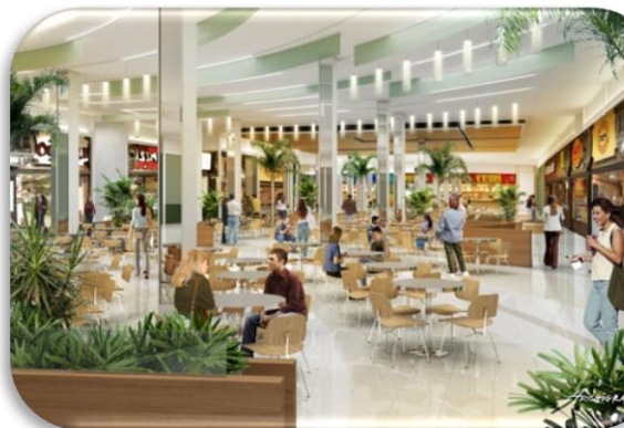
Perspectiva da nova praça de alimentação do BH Shopping