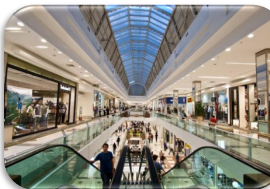
Perspectiva de Expansão V do BH Shopping

A Expansão V do BH Shopping tem sua inauguração programada para julho de 2010, e adicionará 11.015 m 2 de ABL ao shopping. O Capex total deste projeto é de R$124,3 milhões (50,3% dos quais já realizados), e a Multiplan espera um NOI no terceiro ano de R$11,9 milhões. Esta expansão já é considerada um sucesso de locação, dado que em novembro de 2009 (oito meses antes da data de inauguração prevista), 93% das 104 lojas já haviam sido locadas.